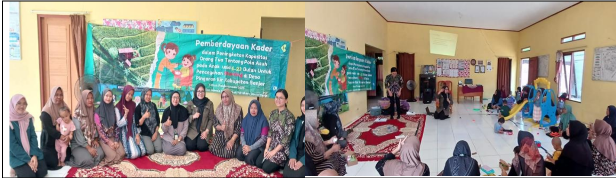
Gambar 3. Kegiatan Penyerahan Alat Permainan Edukatif yang ditandatangani oleh Kepala desa dan Perwakilan Kader Pingaran Ilir Kecamatan Astambul Kabupaten Banjar